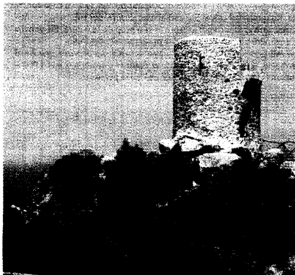
La talaia d'es Verger, coneguda també com a la Torre de ses Ànimes.