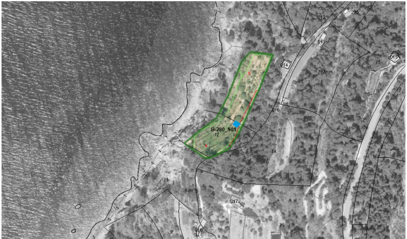
sa Font de sa Menta