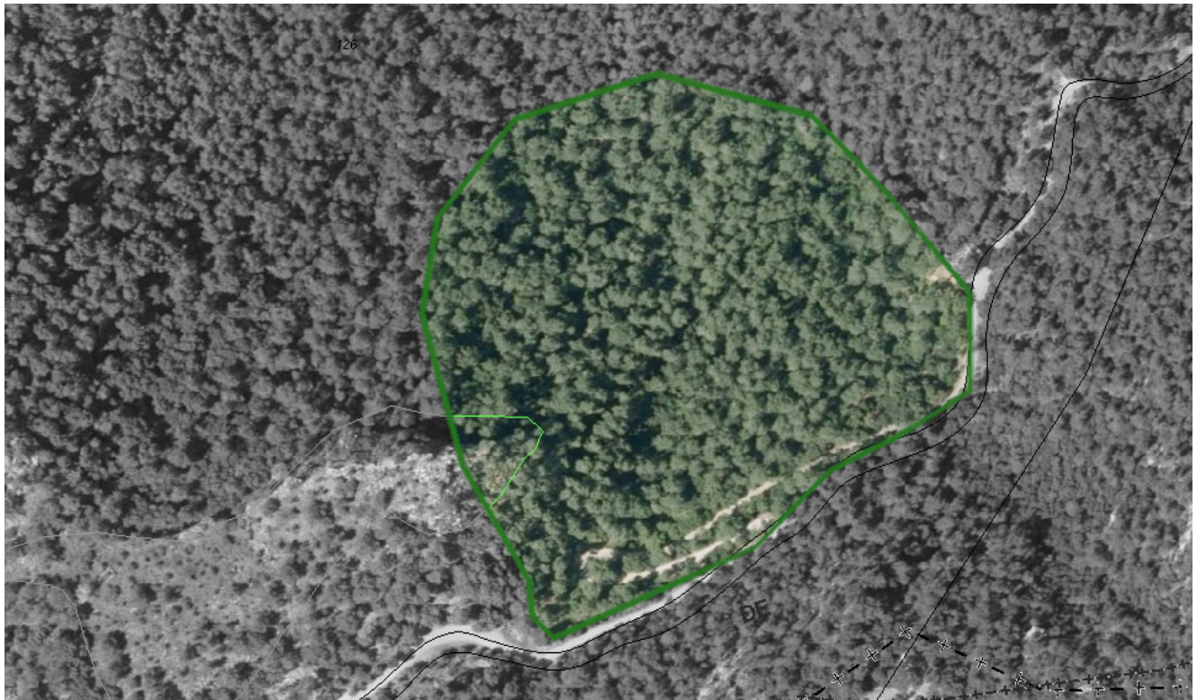
Port des Canonge-Son Coll-Son Bujosa