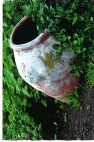
Possibles focus de moscardes